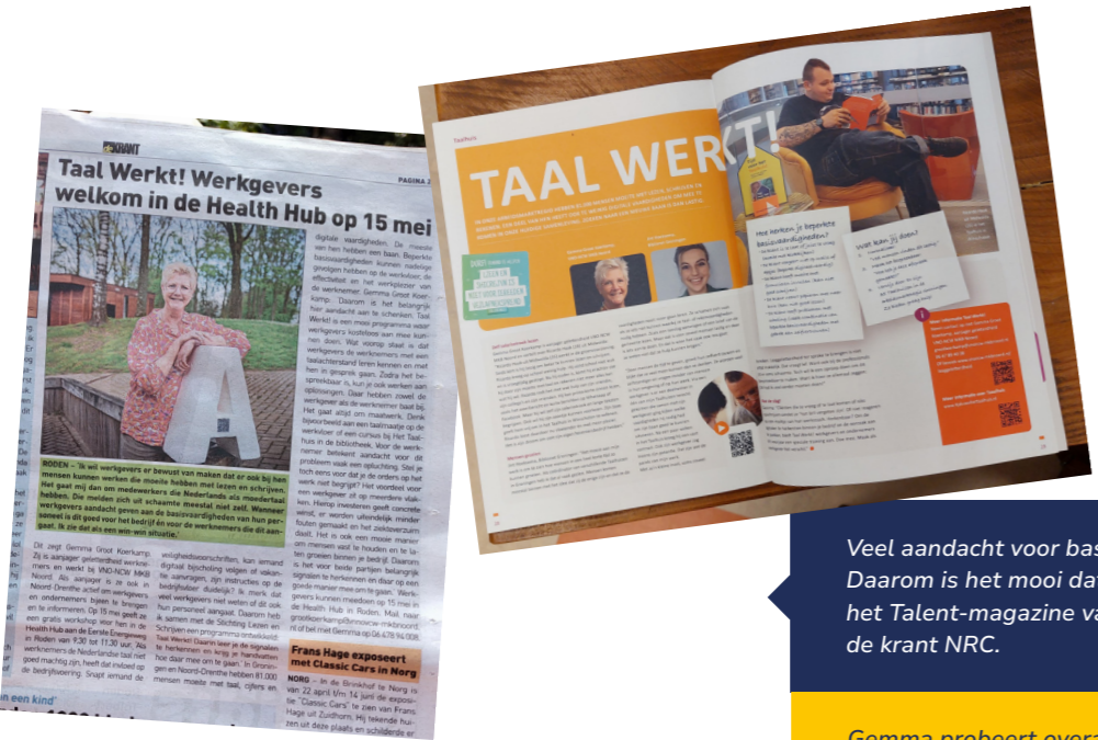
Veel aandacht voor basisvaardigheden is erg belangrijk. Daarom is het mooi dat er artikelen waren over Taal Werkt! in het Talent-magazine van WIZ, De Krant in Noordenveld en in de krant NRC.