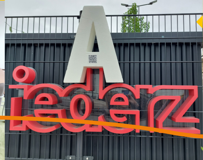
De aanjager gaat vaak met de letter A op pad. Dat trekt aandacht. Ook deelt ze vaak letterkoekjes uit. Dat helpt ook om het onderwerp luchtig te maken.